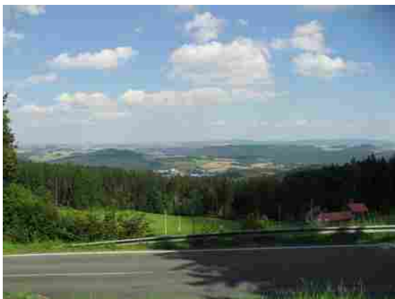
Výhled od Výhledů